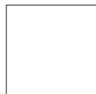
RAL a elegir