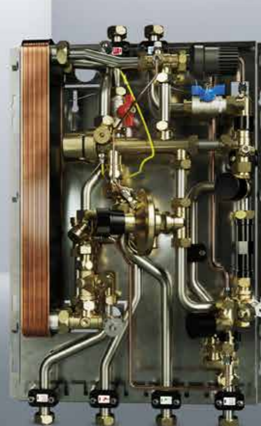
Uponor Combi Port T1000

Ideales para sustituir calderas murales en viviendas