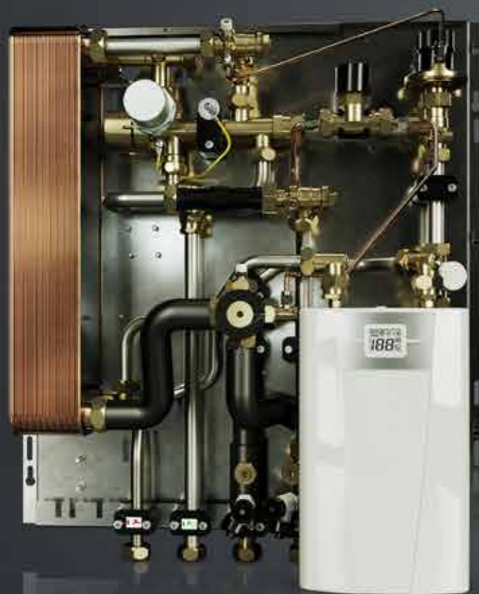
Uponor Combi Port B1000 HY

Versión híbrida para sistemas de baja temperatura