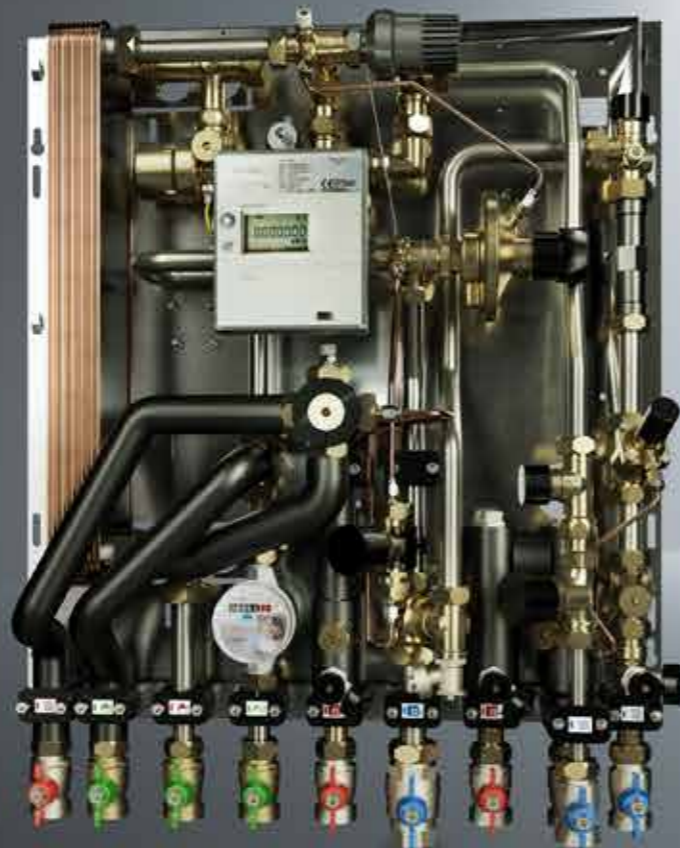
Uponor Combi Port B1000 3P

Estación de 3 tuberías para sistemas de bomba de calor más eficientes