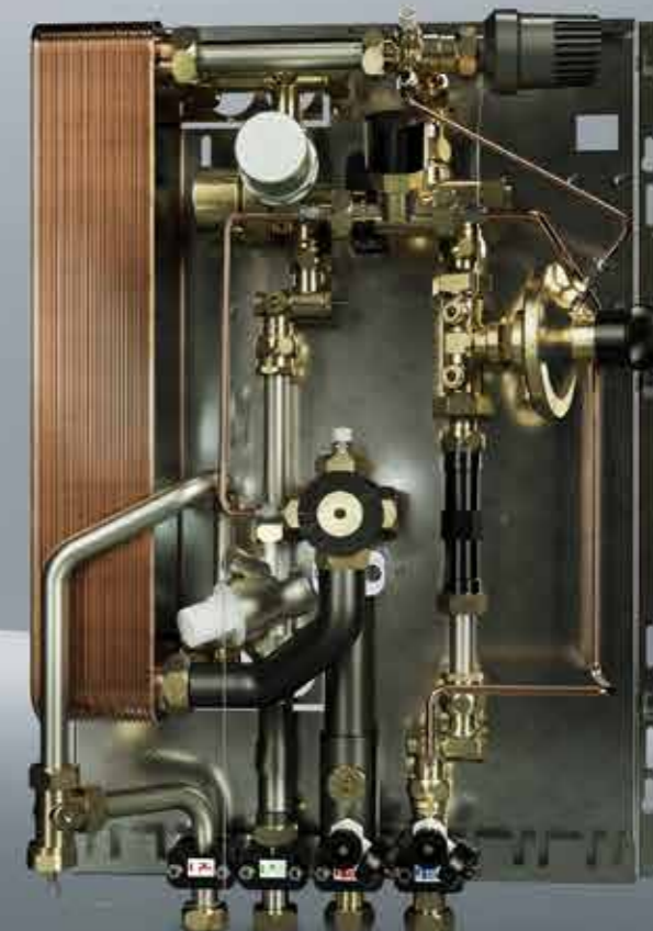
Uponor Aqua Port S1000